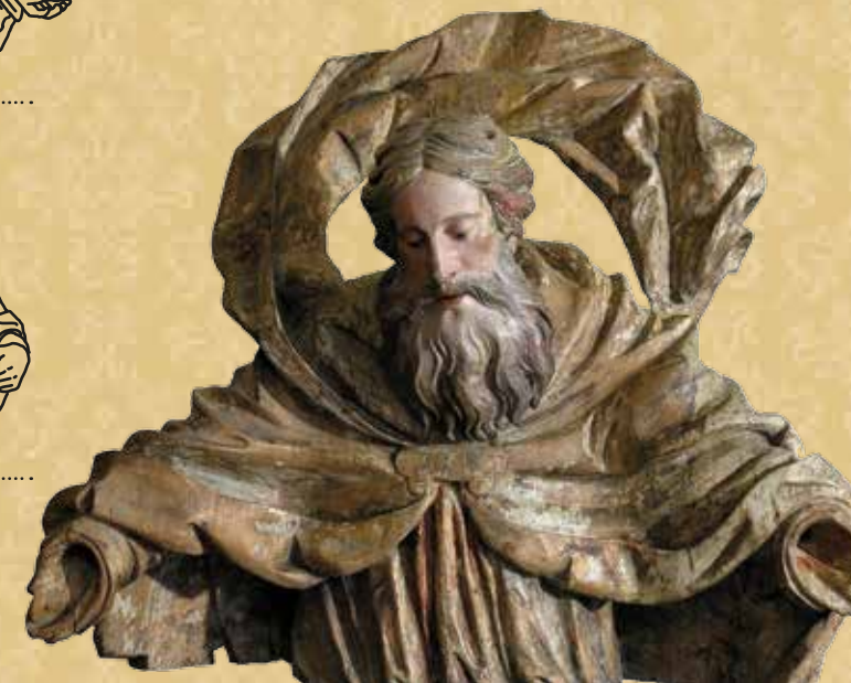
Andreas Johann Eglauer: Boh Otec. 1722.

Určite si si všimol, že mnohým sochám na výstave chýbajú ruky, ktoré sa im často nezachovali. Väčšinou v nich držali predmet (atribút), ktorý vystihuje ich život, a preto niekedy nevieme presne zistiť, o akého svätého alebo svätú ide.