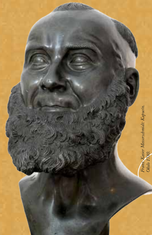
Franz Xaver Messerschmidt: Kapucína. Okolo 1780.

☞ Originálom od tohto slávneho sochára, ktorý býval aj v Bratislave, je hlava Kapucína . Aký má výraz tváre?