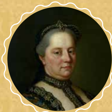
Viedenský maliar: Portrét Márie Terézie. Okolo 1767 (detail).

www.facebook.com/Galeria.Mesta.Bratislavy