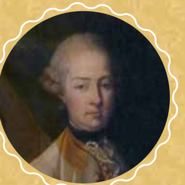
Viedenský maliar: Portrét Jozefa II. Po 1764 (detail).

Mária Terézia, ktorá vládla v rokoch 1741 – 1780, mala 16 detí a zaviedla povinnú školskú dochádzku pre deti od šesť do dvanásť rokov. Nechala prestavať Bratislavský hrad, kde bývala jej dcéra Mária Kristína so svojim manželom Albertom Sasko-Tešínskym . Následníkom Márie Terézie na tróne sa stal jej syn Jozef II.