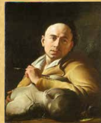
Paul Troger: Portrét sochára Juraja Rafaela Donnera. 1727–28.