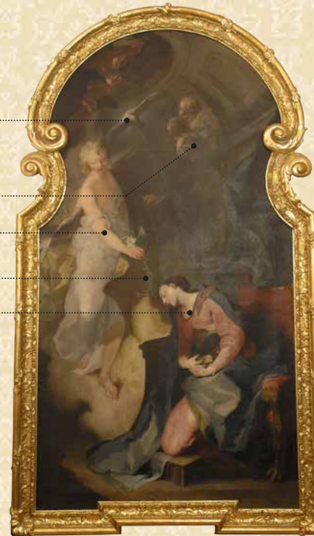
Franz Anton Palko: Zvestovanie Panny Márie. Okolo 1758.